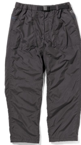
AREA241- WARM PANTS