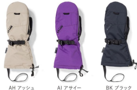
AH アッシュ ASH