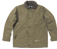
AREA241-FR FIELD JACKET