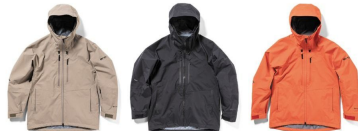
AH アッシュ ASH