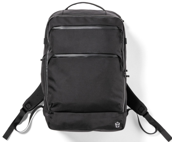
BK ブラック BLACK