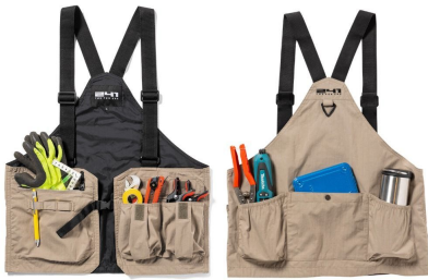
AREA241- CRUISER VEST