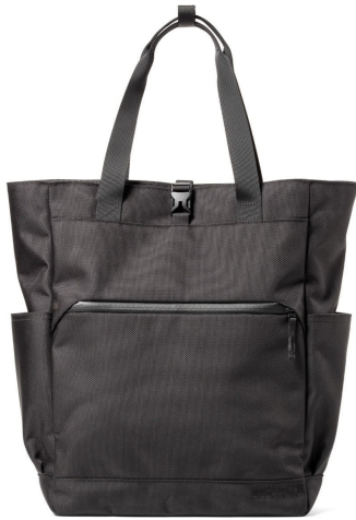
BK ブラック BLACK