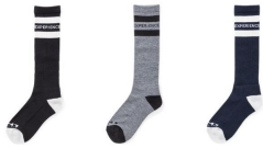
BK ブラック BLACK