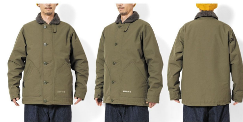
OT オッター OTTER