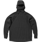
AREA241- WAFFLE HOODIE