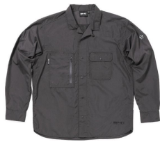
AREA241-DWR WORK LS SHIRTS