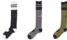
BK ブラック BLACK