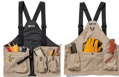
AREA241- CRUISER VEST