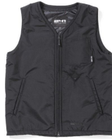
AREA241- HEATING VEST