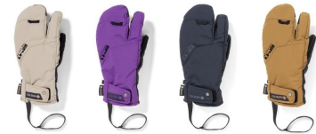
AH アッシュ ASH AI アサイー ACAI BK ブラック BLACK OT オッター OTTER