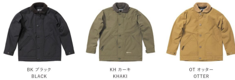
BK ブラック BLACK