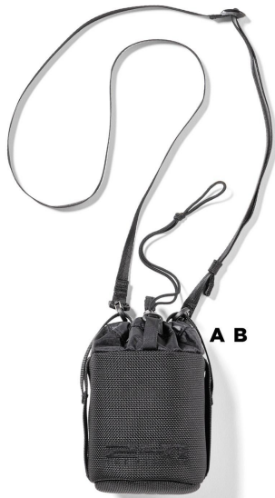
BK ブラック BLACK