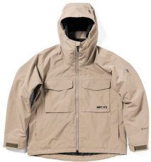
AREA241- WONDERER JACKET