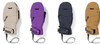
AH アッシュ ASH AI アサイー ACAI BK ブラック BLACK OT オッター OTTER