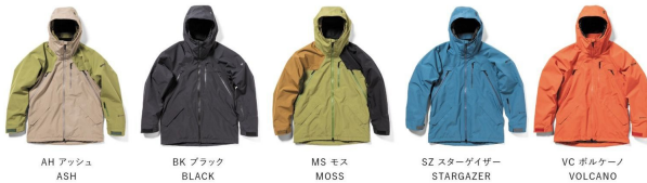
AH アッシュ ASH