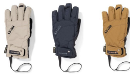
AH アッシュ ASH BK ブラック BLACK OT オッター OTTER