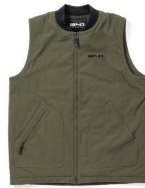
AREA241-FR INSULATED VEST