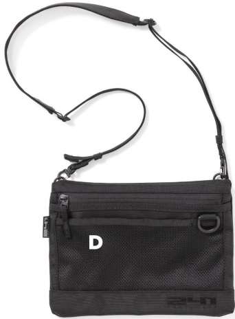
BK ブラック BLACK