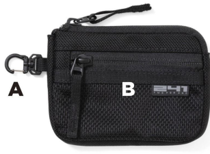
BK ブラック BLACK

コインケースやカードケースとして使える細かなものを収納するのに便利な小物入れ。メッシュのサブポケットも配置し、小さいながら2ルーム仕様。無くない様にキーフックなどにも引っ掛けられる小型ナスカンを装備。